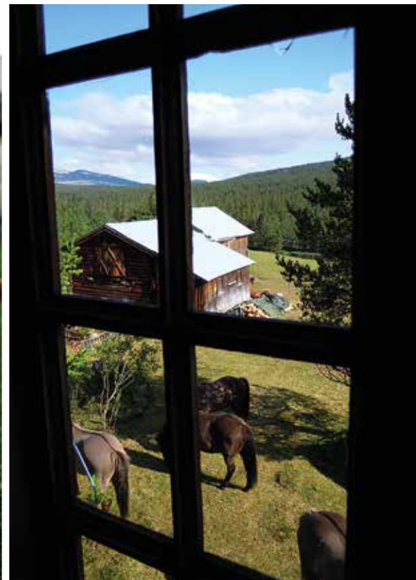
Om veien videre er og har vært bort fra menneskene? Tvert om. Mennesker kommer når jeg blir den jeg er, og relasjonene vokser i kvalitet.